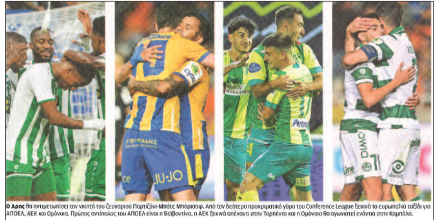
Ο Άρης θα αντιμετωπίσει τον νικητή του ζευγαριού Παρτιζάνι-Μπάτε Μπορίσοφ. Από τον δεύτερο προκριματικό γύρο του Conference League ξεκινά το ευρωπαϊκό ταξίδι για ΑΠΟΕΛ, ΑΕΚ και Ομόνοια. Πρώτος αντίπαλος του ΑΠΟΕΛ είναι η Βοϊβοντίνα, η ΑΕΚ ξεκινά απέναντι στην Τορνέντο και η Ομόνοια θα αγωνιστεί ενάντια στην Καμπάλα.

Από την Σερβία προέρχεται η αντίπαλος του ΑΠΟΕΛ και συγκεκριμένα η Βοϊβοντίνα , στον 2° προκριματικό γύρο του Γιουρόπα Κόνφερενς Λιγκ. Οι 'τουλίπες' όπως είναι το παρατσούκλι τους τερμάτισαν στην 5 η θέση του