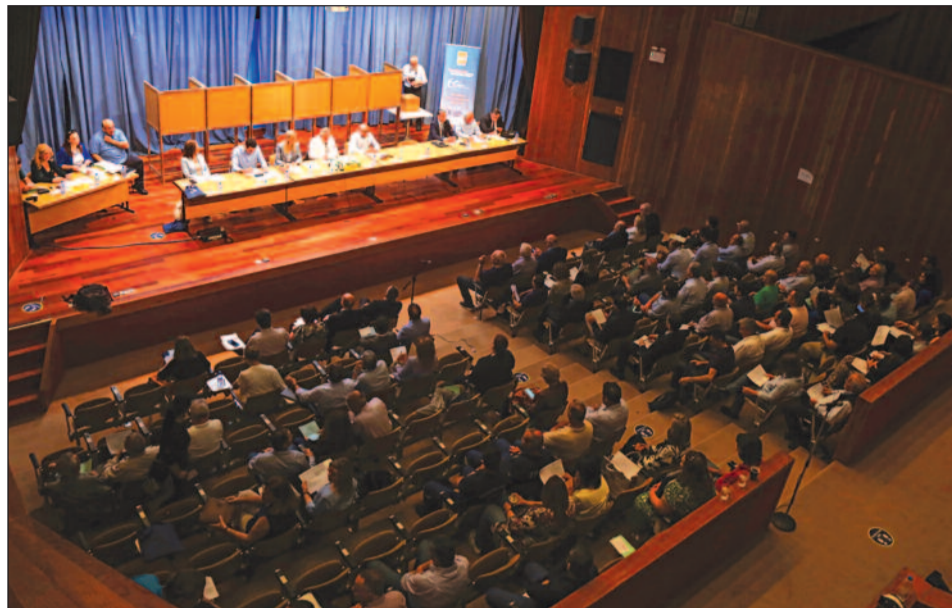
Αλλαγές στο Καταστατικό ενέκρινε το Καταστατικό Συνέδριο.

Με ιδιαίτερη ικανοποίηση ακούσαμε την εξαγγελία του Προέδρου της Δημοκρατίας από το βήμα του Συνεδρίου μας για στα-