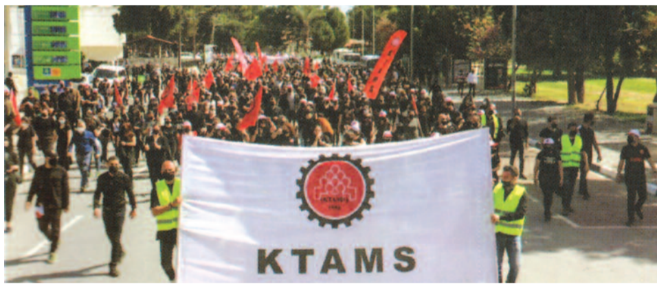
Φωτογραφία αρχείου από διαδήλωση της ΚΤΑΜΣ

«Η ταυτότητα, η κουλτούρα και η πολιτική βούληση των Τουρκοκυπρίων εξαφανίζονται. Το πολιτικό σας μέλλον και τα κομματικά σας συμφέροντα έχουν έρθει πάνω από τα συμφέροντα της χώρας και το μέλλον των παιδιών μας. Δεν πονάει ποτέ η συνείδησή σας; Μπορείτε να κοιμάστε ήσυχοι το βράδυ, δεν σας νοιάζει καθόλου;» ■