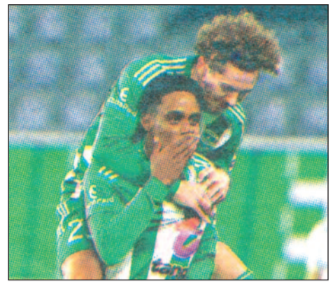
Σαλαμίνα, Καρμιώτισσα εκτός και ΑΠΟΕΛ εντός.